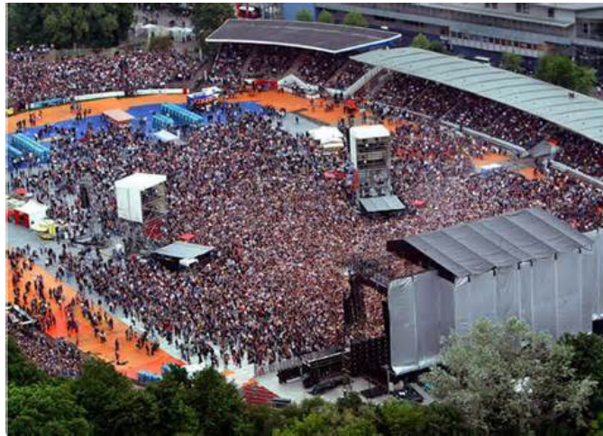
Eine von vielen Musik- und Kulturveranstaltungen des Hessentags im Auestadion mit tausenden Besuchern.