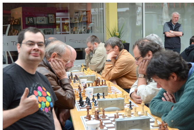
"Schlacho" wie immer gut drauf.

Die seit Jahrzehnten bewährte SK Vellmar-Helfertruppe um Organisator Rainer hatte alle Turniervoraussetzungen wieder bestens auf die Reihe bekommen. Die äußeren Bedingungen waren zwar nicht gerade überwältigend gut, vormittags bedeckt, aber nicht kalt, nachmittags Sonnenschein mit sehr angenehmen Temperaturen. Alles in trockenen Tüchern sozusagen. Die Spannung im Vorfeld war groß, würde es abermals gelingen, Die Glanz- und Gloria-Vorstellung des Vorjahres 2012 wenigstens annähernd zu erreichen, oder vielleicht sogar zu übertreffen? Die Bilanz nach Ablauf der Meldefrist musste frustrierend wirken. Nur 32 Teilnehmer hatten sich eingefunden, so wenig, wie lange nicht mehr. Frauen und Mädchen - totale Fehlanzeige, das hatte es auch noch nie gegeben. Einige Jugendliche musste man sporadisch mit der Lupe suchen, auch so wenige wie noch nie. Woran lag es? War es der