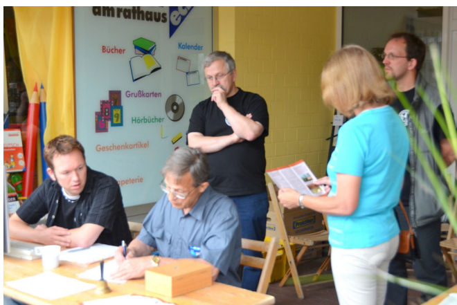
Rainers unverzichtbares Helferteam.