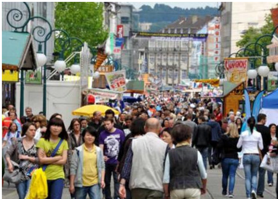
Die von Menschenmassen überquellende City von Kassel.

Die Hessentagswoche im benachbarten Kassel . In der HNA-Ausgabe vom 17.06.2013 war nachzulesen, dass sich am Wochenende 15./16.06.2013 ca. 360.000 Hessentagsbesucher auf Kassels Straßen drängten, um allen möglichen Musikveranstaltungen und sonstigen in Hülle und Fülle stattfindenden kulturellen Ereignissen beizuwohnen zu können ! Wie viele potentielle Schachspieler für das Open Air in Vellmar mögen wohl überall dabei gewesen sein ? Aber Bange machen gilt nicht, es ist nicht jedes Jahr Hessentag in Kassel, es kommen