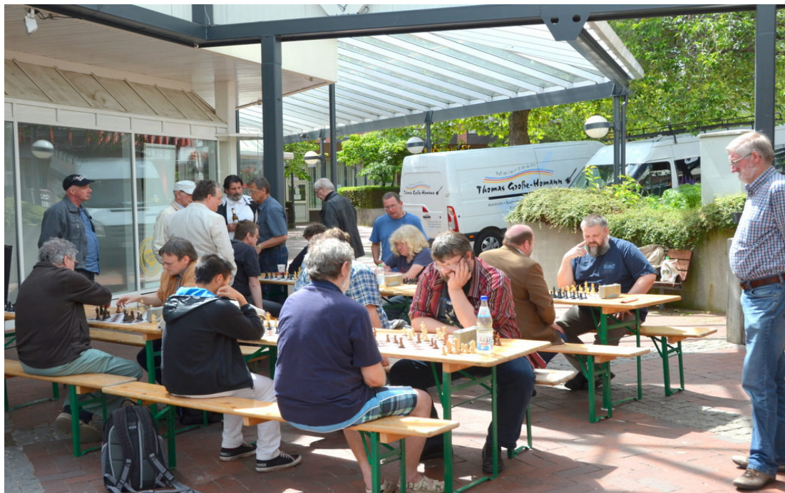
Nachmittags schien die Sonne auf den Rathausplatz. Im Bild die vorderen Spieltische.

Sonntag, 16.06.2013 , es war wieder einmal soweit, einer der jährlichen Turnier-Höhepunkte des Schachklubs Vellmar rollte erneut vom Stapel. Es war inzwischen die 22. Auflage und die gute Tradition fand ihre Fortsetzung: Das Open Air Schnellschach-Turnier 2013 auf dem überdachten Rathausvorplatz.